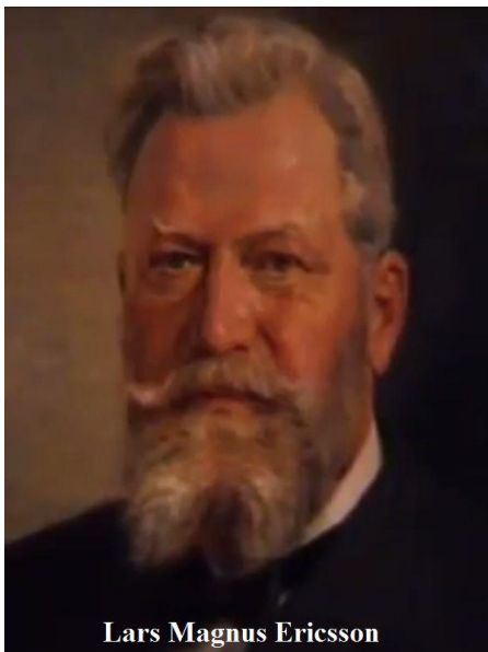
Lars Magnus Ericsson

När Lars Magnus Ericsson i april 1876 startade sin elektromekaniska verkstad i Stockholm kände han inte till att uppfinningen av telefonen som hade gjorts några månader tidigare i Amerika. Bell var jämnårig med Lars Magnus Ericsson. Som lärare vid en dövstumsskola och vid universitetet i Boston studerade Bell talljudens natur. Han gjorde försök med